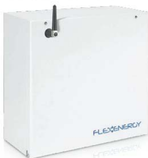
Le nuove centrali antintrusione Flexenergy di IESS

La scelta di un'azienda che - nell'ambito della produzione dei sistemi di sicurezza - ha deciso di puntare sulla specializzazione e sulla differenziazione del servizio